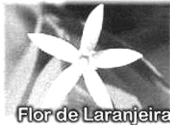
Flor de Laranjeira